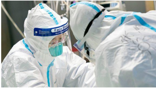
Médicos en el hospital Zhongnan de Wuhan, China, el 24 de enero de 2020.