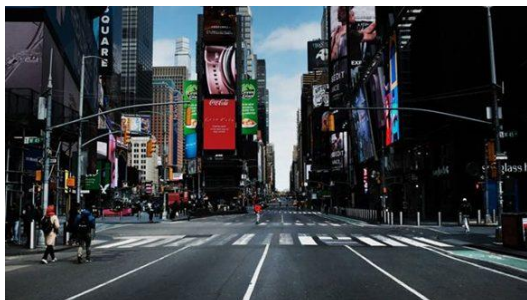
Las calles de Manhattan están desiertas por las restricciones para detener al coronavirus.

Con el fracaso del liderazgo de Estados Unidos se abre un peligroso vacío de potencia. El juego de tronos se relanza peligrosamente. La Unión Europea, como hemos visto, también ha salido mal parada por su decepcionante falta de cohesión durante la pandemia. China y Rusia en cambio han consolidado su rol internacional prestando asistencia a muchos países desbordados por el colapso de su sistema sanitario. ¡Han ayudado incluso a Estados Unidos! Hemos visto imágenes insólitas: aviones militares rusos aterrizando en Italia, ofreciendo médicos y distribuyendo material de salud. China ha donado a un centenar de países millones de kits de detección, mascarillas, ventiladores pulmonares, escafandras protectoras y toda clase de logística sanitaria. «Somos olas de un mismo mar, hojas de un mismo árbol, flores de un mismo jardín.» decían hermosamente los contenedores que China ha ofrecido a buena parte del mundo. La influencia internacional de Pekín ha crecido.