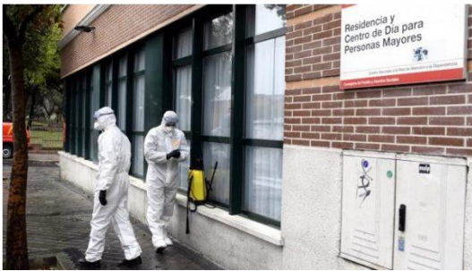
Desinfectan Residencia de Ancianos en Madrid con varios fallecidos.

O sea, que la espectacular supremacía tecnológica de la que tanto nos ufanábamos, con nuestros teléfonos inteligentes de última generación, los drones futuristas, los robots de ciencia ficción y las biotecnologías innovadoras han servido de poco, como ya lo hemos dicho, a la hora de contener el primer impacto de la marea pandémica. Para tres objetivos urgentísimos -desinfectarnos las manos, confeccionar mascarillas y frenar el avance del virus-, la humanidad ha tenido que recurrir a productos y a técnicas viejos de varios siglos atrás. Respectivamente: el jabón, descubierto por los romanos antes de nuestra era; la máquina de coser, inventada por Thomas Saint en Londres hacia 1790; y, sobre todo, la ciencia del confinamiento y del aislamiento social, afinada en Europa contra decenas de oleadas de pestes sucesivas desde el siglo V... 61 ¡Qué lección de humildad!