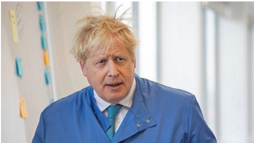
Primer ministro del Reino Unido, Boris Johnson. El político continuará recuperándose de la enfermedad en Chequers, su residencia en la localidad de Ellesborough.